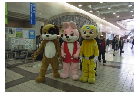
いつも人気のマスコット