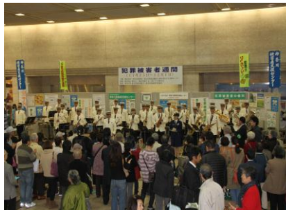
恒例の神奈川県警音楽隊の演奏