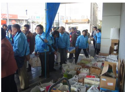
用意したグッズは約3,000セット