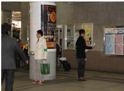
東海大学生2名も参加

京急川崎駅のご協力により、駅構内を使用させていただきました。ありがとうございました。