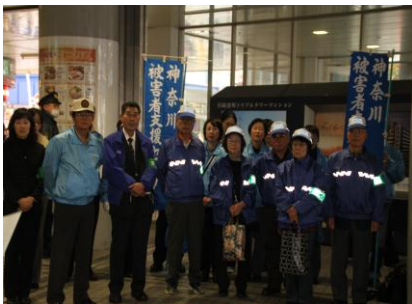
地域防犯パトロールのみなさま