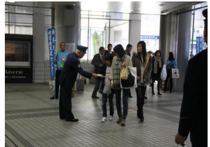
川崎警察署長もグッズを配布