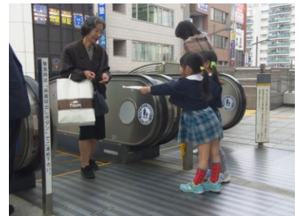
南大野幼稚園の園児もお手伝い