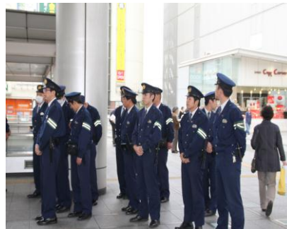
相模原南警察署のみなさん