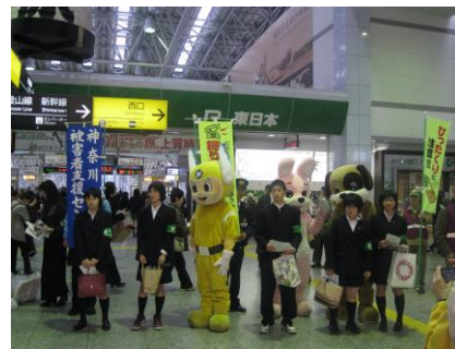
県立小田原高校剣道部のみなさん