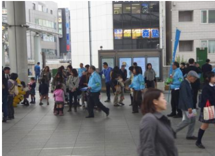
「犯罪被害者支援キャンペーンです。」