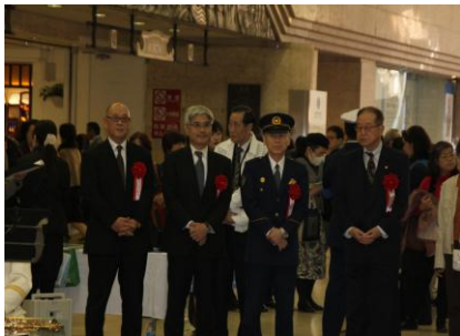
県・県警・支援センター